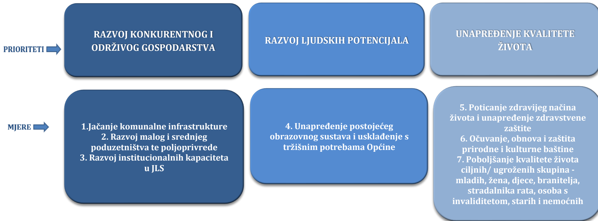
Slika 2. Pregled temeljnih strateških prioriteta i mjera